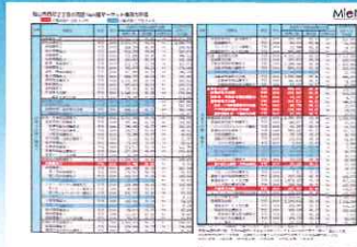
【マーケット購買力評価】

◀性別や年代別の人口分布を把握し、自社のサービスのニーズを知ることで、新規出店時の立地の選定等に役立ちます。